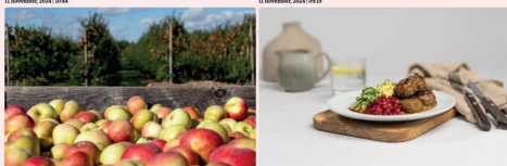
Ett gynnsamt år för svenska äpplen 11 november 2024 12:12