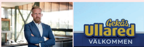
Falska leveransbesked i omlopp 11 november 2024 12:14